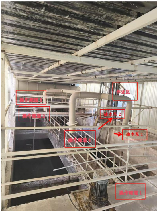
图 2 集水池现场图

事发区域为污水处理站集水池，现场为一长方形水池，长 17.6 米，宽 6.1 米，深 5.5 米，池中有 4 条操作廊道，其中 3 条为东西走向，在集水池地平面上，1 条为南北走向，在集水池地平面以下中部位置。集水池对角处(东南—西北)有 2 台推流器，用于搅匀粪浆，集水池西侧有 2 台水泵(抽取粪浆，经常堵塞需清理)，通过水泵将搅拌均匀后的粪浆抽至固液分离平台进行固液分离，日常工作，只使用 1 台水泵，另 1 台为备用。