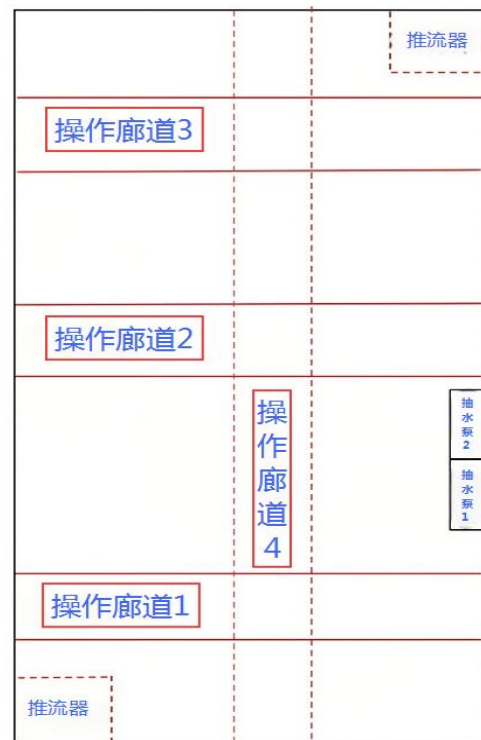
图 3 集水池平面图