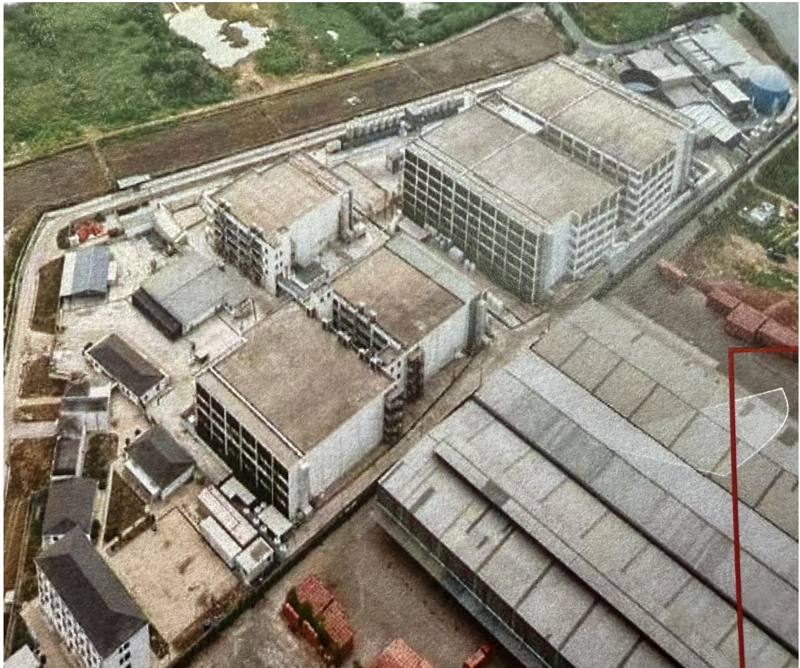
图 1 甬直猪场鸟瞰图